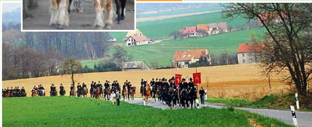
„Osterreiter“