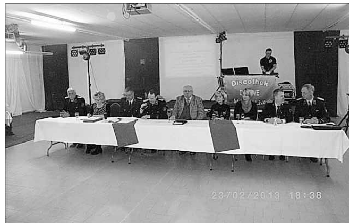
Teilnehmer der Jahreshauptversammlung

Am 23.02.2013 führte die FFW Königswartha ihre Jahreshauptversammlung im ehemaligen Pennymarkt durch.