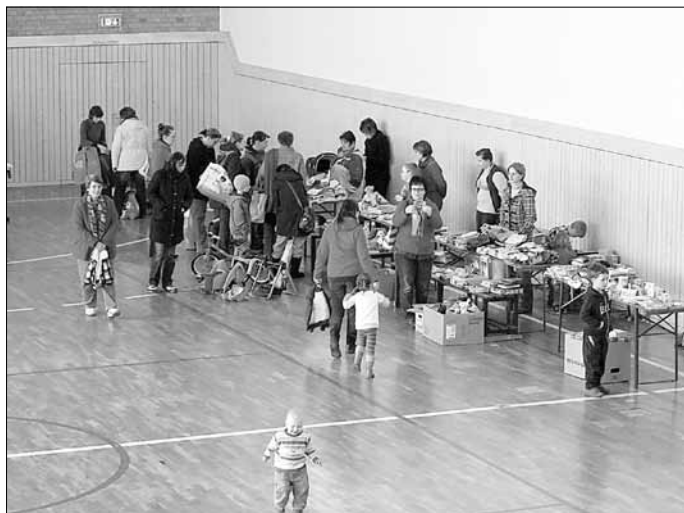
Der größte Stand, gleich am Eingang, wurde von Mitarbeitern unseres Schulvereins „betrieben“.