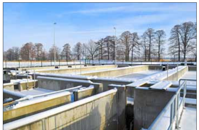
Anlage im Januar 2013