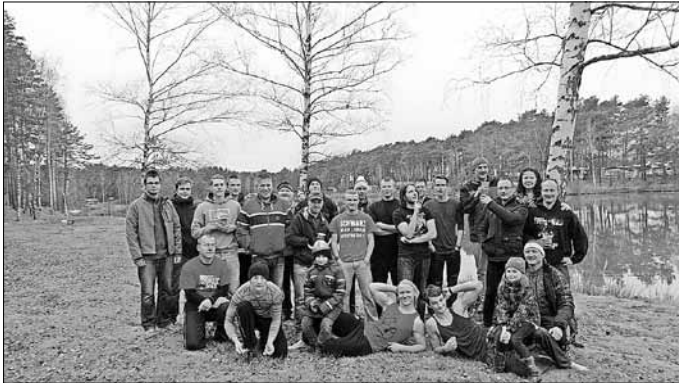
Alle 25 Winterschwimmer