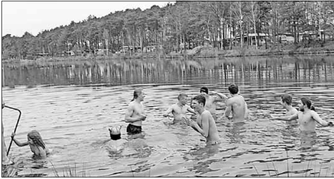
„Es ist kälter, als man denkt!“