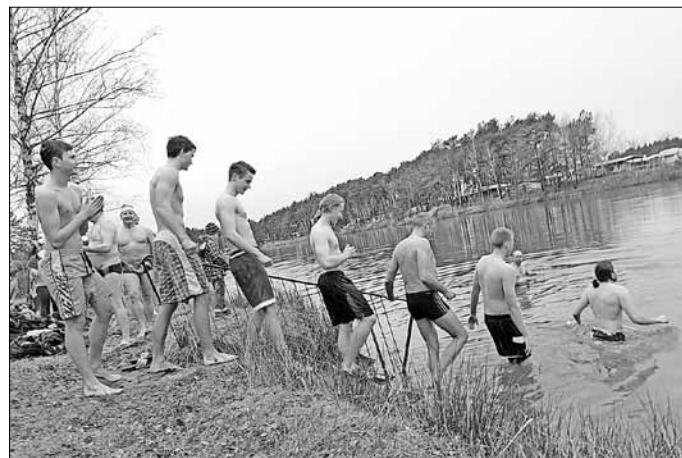
Gedränge an der Treppe

25 mutige Kinder, Jugendliche, eine Frau und Männer stiegen in kalte Wasser.