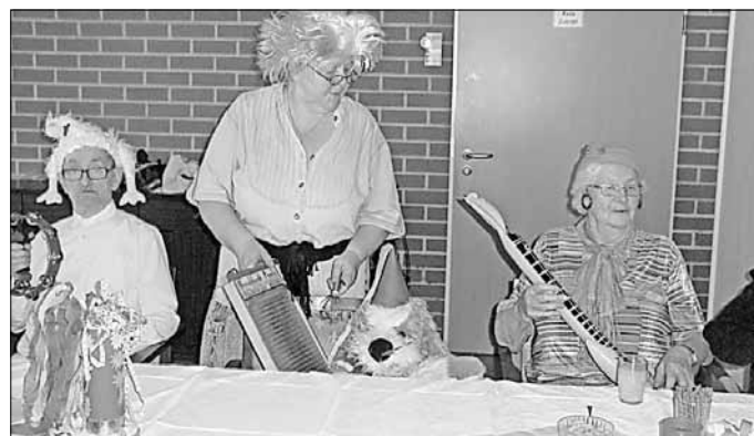
„Die Waschbrettcombo war einmalig!“