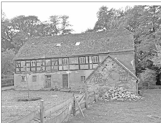
Die Mühle im Jahre 2012