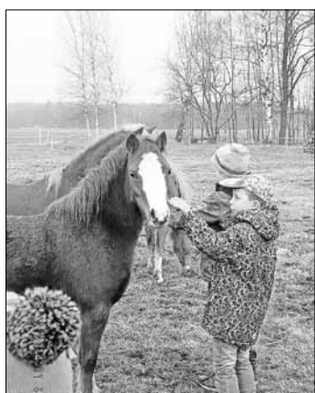
Gut erholt starteten wir in das zweite Schulhalbjahr. Die Kinder und Erzieherinnen vom Hort der CSB-Kindertagesstätte „Zwergenland“ Königswartha