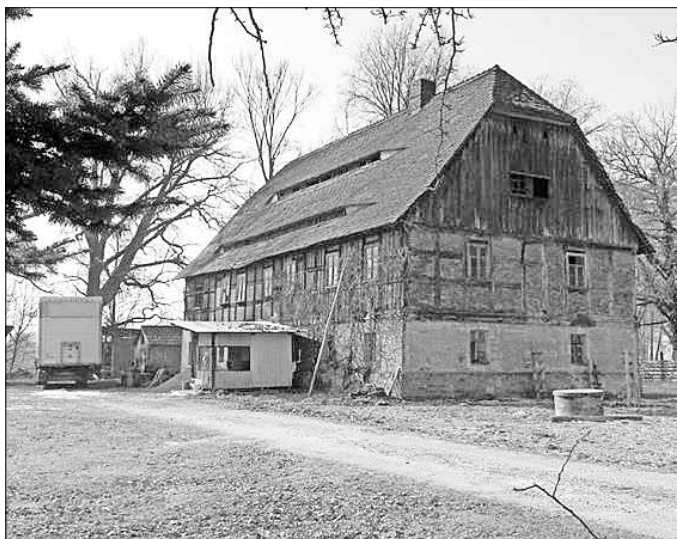
Das Forsthaus im Jahre 2011