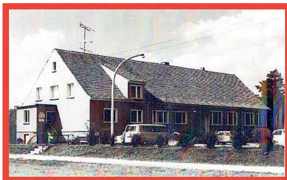
Gaststätte „Tourist“ um 1970