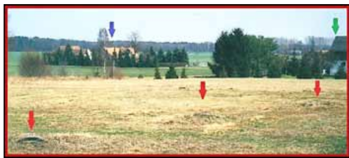
rote Pfeile = Brunnen für Rittergut/blauer Pfeil = Kunze (Pohlan)/grüner Pfeil = Mörbe

Im Rittergutshof, an der Pferdetränke und am Graben unter den großen Bäumen hinter Suchi (heute Reck), befand sich noch bis ca. 1960 je ein Überlauf. Die Leitung konnte dadurch nicht einfrieren.