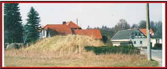
Buckel der Zisterne

Verfasst, fotografiert und zusammengestellt von Werner Strümpe.