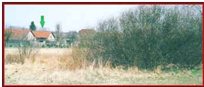
Grüner Pfeil = Schneider (Noack, G.)

Für Alt-Oppitz wurde später eine zweite Leitung mit größerem Durchlass gebaut. An der Siedlung, unterhalb der Grundstücke Herold und Dorn, befinden sich dafür zwei Brunnen, die aber jetzt mit Strauchwerk zugewachsen sind.