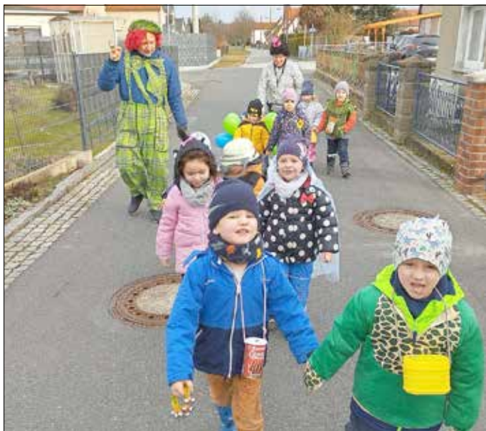
Kinder der Igel-Gruppe mit ihrer Erzieherin

Aus Asche wird neues Leben entstehen, wenn etwas Erde untergemischt und kleine Samen eingebracht werden. So erleben die Mädchen und Jungen der Kita die Fastenzeit mit dem erwachenden Frühling und schauen dem Osterfest erwartungsvoll entgegen.