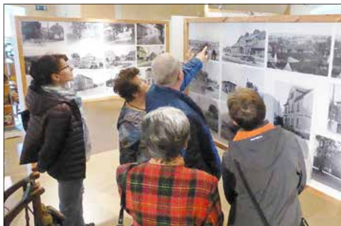
- Besucher in der Ausstellung -

Über die Zeit danach, die Beseitigung der Ruinen und den Wiederaufbau in unserer Gemeinde, geben zahlreiche Fotos, die wir in der „Heimatstube“ als Bildergalerie unter dem Namen „Die 50iger Jahre“ präsentieren, Aufschluss.